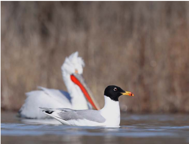
Pallasmöwe und Krauskopfpelikan; Waldohreule