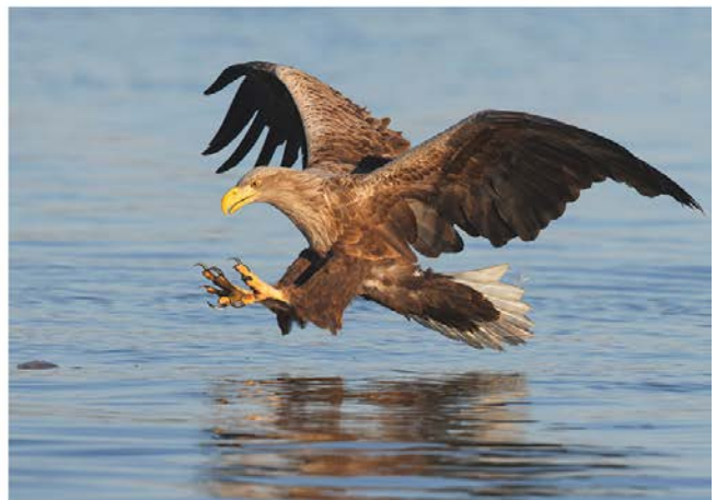
Ein kleiner Ausschnitt der Vogel- und Säugetierarten im winterlichen Donaudelta.