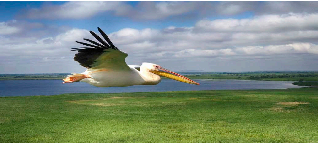
Rosapelikan (Pelecanus onocrotalus) hoch über dem Donaudelta.

Empfehlenswert halten wir das Versicherungspaket „Reise-Komplettschutz“ der Europäischen Reiseversicherung. Dieses Paket kostet € 108,- je Person und beinhaltet einen Stornoschutz bis zu den notwendigen € 1.800,-, darüber auch noch zahlreiche andere Versicherungsleistungen (Reiseabbruch, medizinische Versorgung, Rückholung, Reisegepäck etc.). Informationen senden wir Ihnen gerne zu. Für alle Stornoversicherungen gilt: Achtung auf die Rücktrittsbedingungen - die Versicherung gilt in der Regel nur bei Krankheit, Unfall, Arbeitsplatzverlust etc.