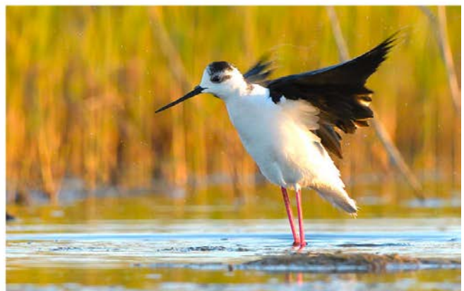
oben: Pelikane bei Sonnenaufgang; unten: Eisvogel und Stelzenläufer