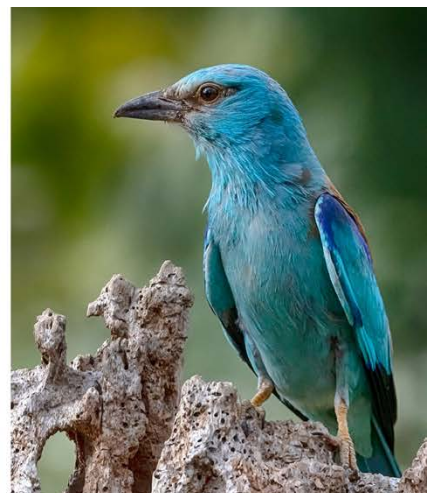
Impressionen aus der fröhlichen Hortobágy-Puszta.