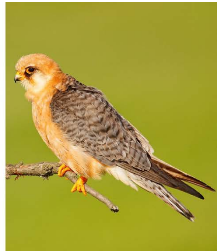
Impressionen aus der fröhlichen Hortobágy-Puszta.