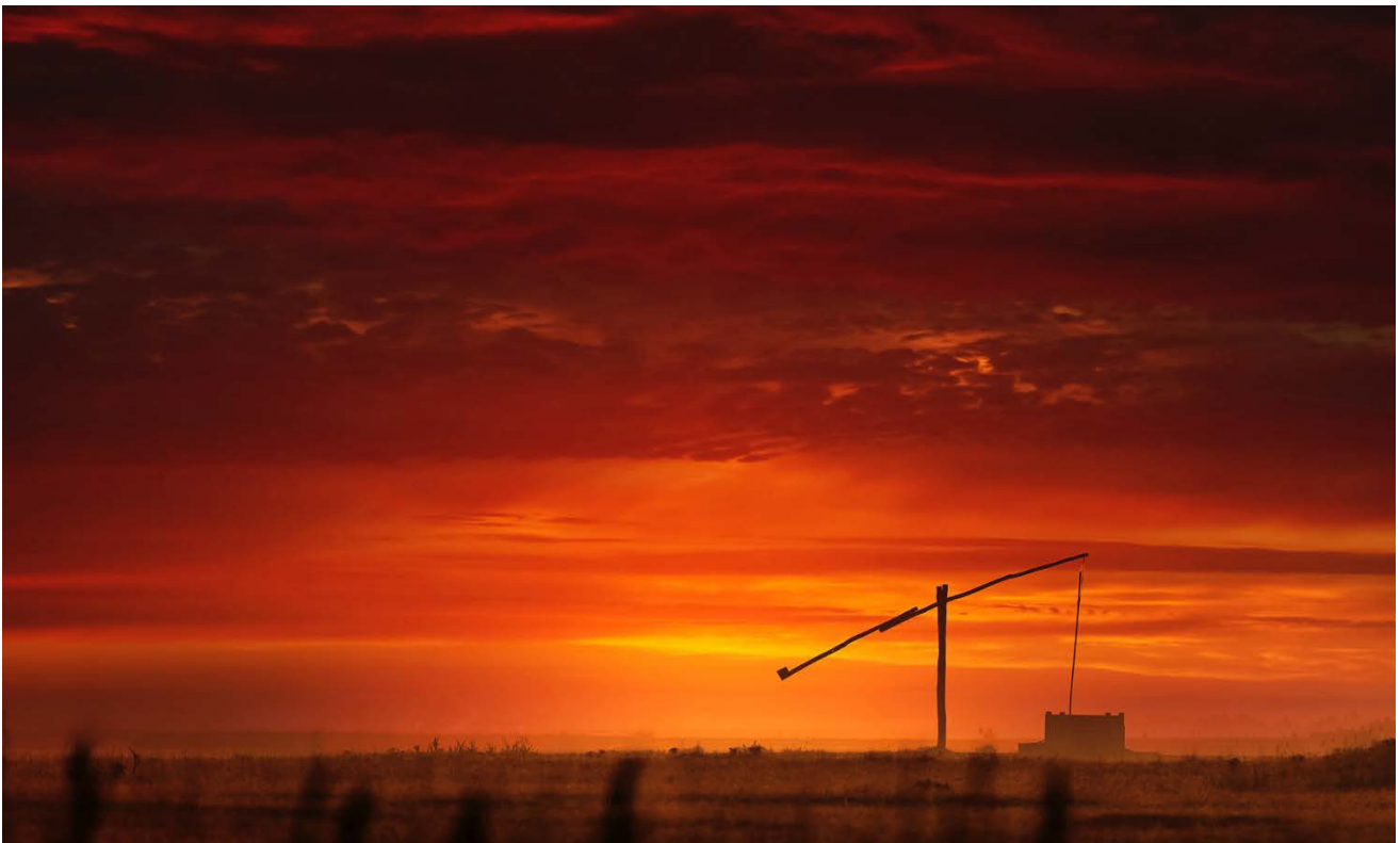
„Das“ klassische Fotomotiv in den Ebenen der Puszta.

Das Herzstück der berühmten ungarischen „Puszta“ ist das etwa 75.000 Hektar große Gebiet des Hortobágy Nationalparks . Diese größte zusammenhängende Grassteppe Europas wurde im Jahr 1973 zum UNESCO Weltnaturerbe erhoben und ist der älteste und größte Nationalpark Ungarns. Ein großer Teil des Schutzgebietes gilt auch als Biosphärenreservat und ist ein international anerkannter und geschützter Lebensraum für zahlreiche Vogelarten.