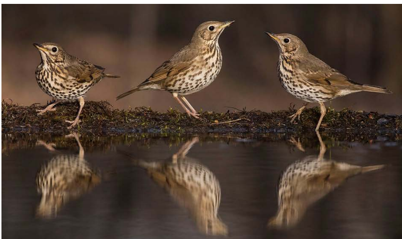
Die sorgfältig angelegten Wasser-Hides sorgen für perfekte Spiegelungen.