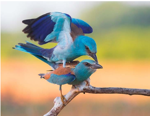
Blauracken und Bienenfresser.

Unser Partner hat in den letzten Jahren in und rund um das Naturschutzgebiet eine ganze Reihe von hochwertigen Fotohides errichtet. Immer noch ist die Region ein Geheimtipp für engagierte Vogel- und Wildlife-Fotograf/innen, dabei steht das Gebiet der bekannten und benachbarten Region von Kiskunság in Ungarn um nichts nach – im Gegenteil, es gibt rund um Subotica mehr Arten an Vögeln und Säugetieren, als es jenseits der Grenze der Fall ist. Alles in allem ist dieser nördlichste Teil der Vojvodina ein perfektes Zielgebiet für Vogel- und Wildlife-Fotograf/innen!