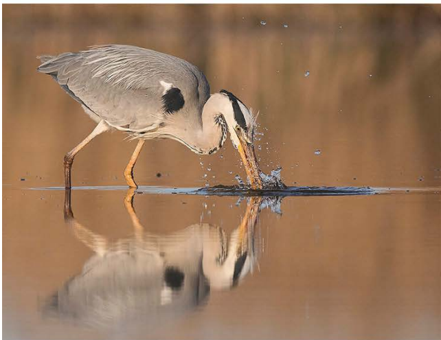
Spezielle Hides, um den perfekten Augenblick festzuhalten.