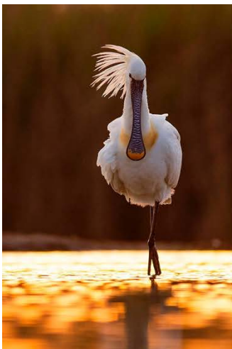
Fotografieren aus speziellen Hides für Wasser- und für Raubvögel.

Empfehlenswert halten wir das Versicherungspaket „Reise-Komplettschutz“ der Europäischen Reiseversicherung. Dieses Paket kostet € 105,- je Person und beinhaltet einen Stornoschutz bis zu den notwendigen € 1.400,-, darüber auch noch zahlreiche andere Versicherungsleistungen (Reiseabbruch, medizinische Versorgung, Rückholung, Reisegepäck etc.). Informationen zu der Reiseversicherung senden wir Ihnen gerne zu bzw. können Sie dieses Versicherungspaket auch bei uns buchen. Für alle Stornoversicherungen gilt: Achtung auf die Rücktrittsbedingungen - die Versicherung gilt in der Regel nur bei Krankheit, Unfall, Arbeitsplatzverlust etc.