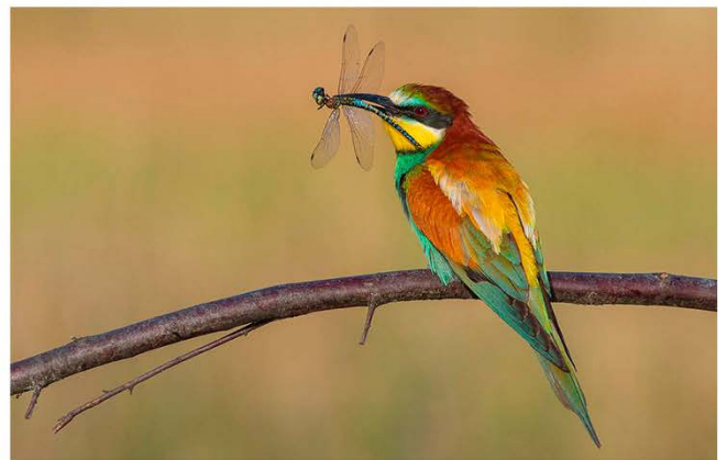
Beste Fotomöglichkeiten aus den tollen Fotohides bei Subotica/Serbien.